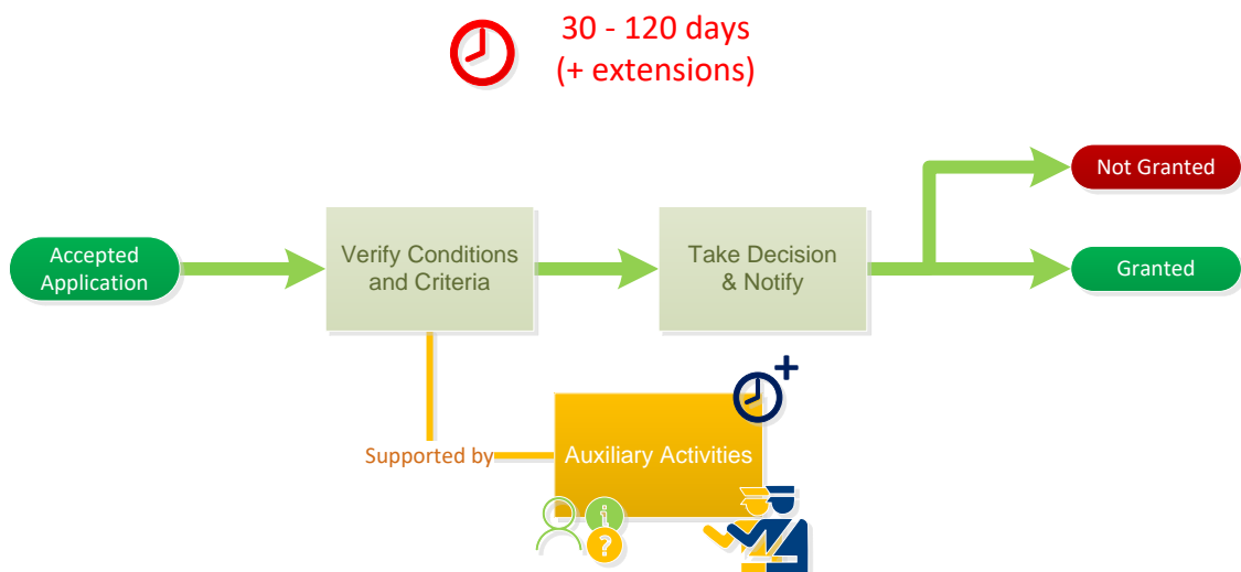
Joonis 1. Otsuse tegemise protsessi ülevaade

Paranduste haldamise protsess on otsustusprotsessi osa. Joonisel 1 (Joonis 1) on esitatud otsustusprotsessi ülevaade. Paranduste haldamise protsess on üks abitegevusi.