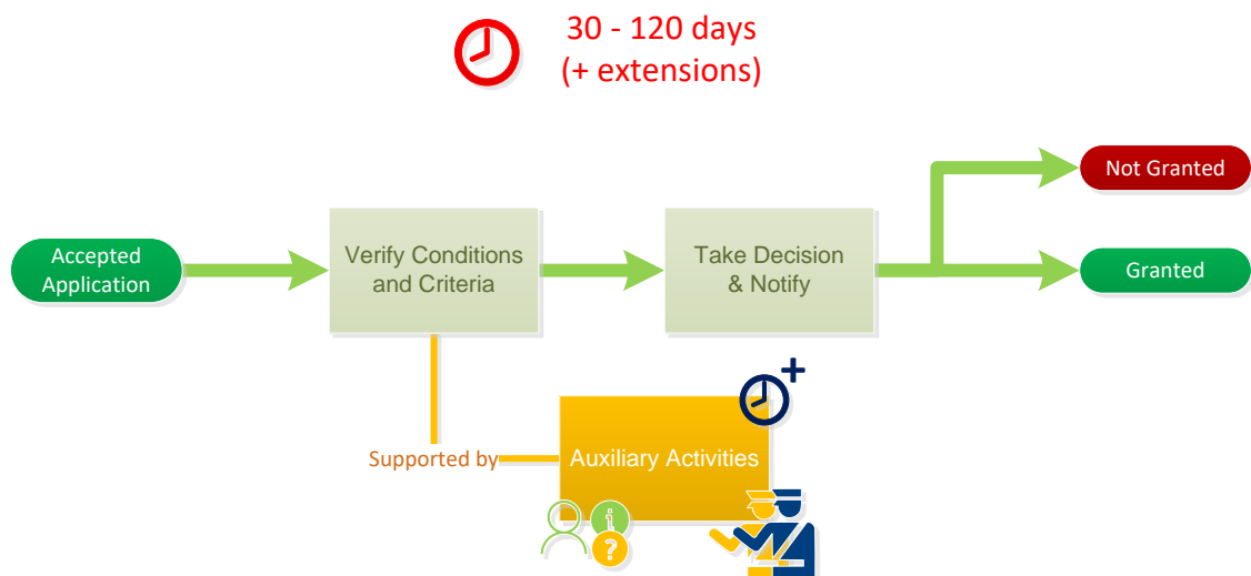
Joonis 1. Otsuse tegemise protsessi ülevaade

Tähtaja pikendamise protsess on otsustusprotsessi osa. Joonisel 1 on esitatud otsustusprotsessi ülevaade. Tähtaja pikendamise protsess on üks abitegevusi.