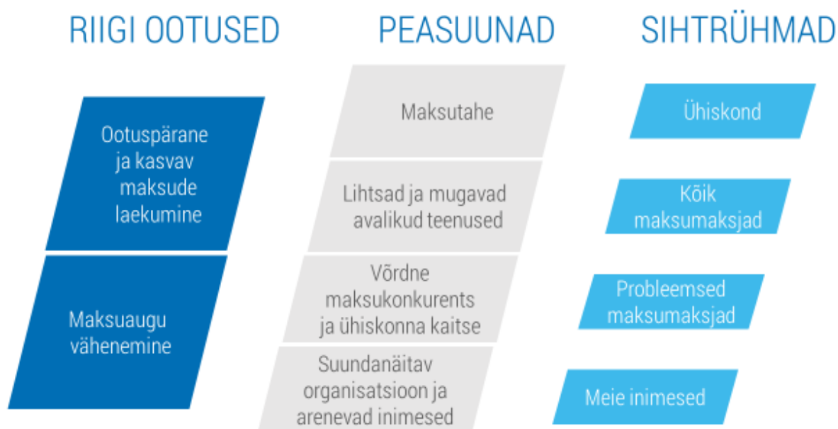
Joonis: Maksu- ja Tolliameti strateegiapilt: riigi ootused ja strateegilised peasuunad

Maksu- ja Tolliameti strateegiapilt koosneb asutusele seatud riigi ootustest ja valitud pikaajalistest strateegilistest suundadest, mille alla koonduvad 2020. aasta eesmärgid: